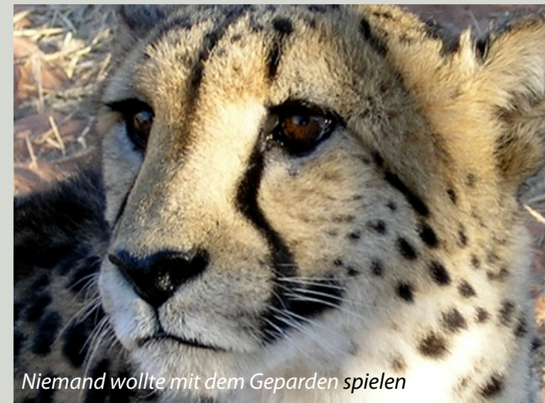
Niemand wollte mit dem Geparden spielen

Auch der Gepard machte sich auf die Suche nach einem passenden Gefährten. Er versuchte es zunächst bei der Oryxantilope. Sie wollte jedoch nicht mit Geparden spielen. Auch beim Leoparden hatte er kein Glück. So ging es den ganzen Tag weiter. Am Ende des Tages blieb der Gepard allein zurück. Er legte sich hin und weinte die ganze Nacht bitterlich. Noch heute sind in den Gesichtern die Tränenspuren dieser Nacht zu sehen. Es ist die schwarze, charakteristische Linie von den Augen bis zum Mundwinkel.