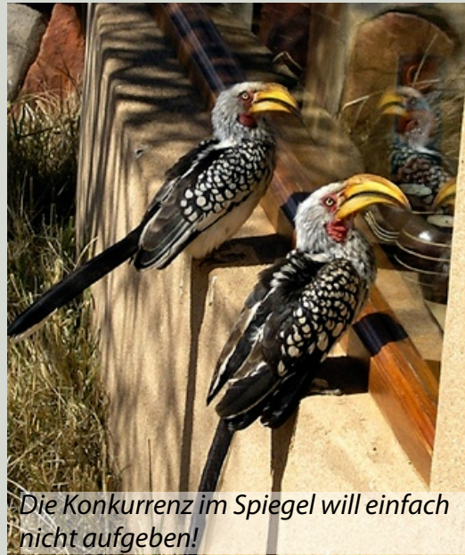
Die Konkurrenz im Spiegel will einfach nicht aufgeben!

Da an Schlaf nicht mehr zu denken ist, erinnere ich mich an das von Clive empfohlene Alternativprogramm für den Mittagschlaf: Wer es etwas aktiver angehen mag, der kann auf dem Gelände um die Unter-