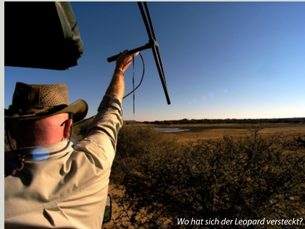
Wo hat sich der Leopard versteckt?