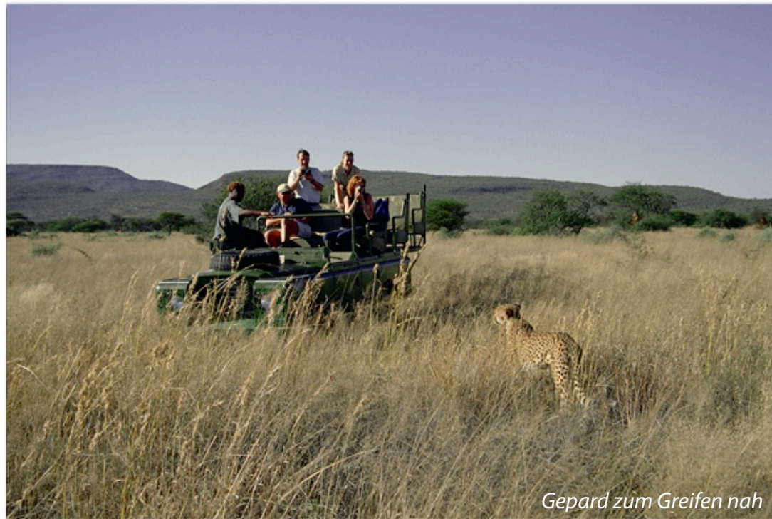
Gepard zum Greifen nah

Es ist Sommer in Europa, in Namibia herrscht tiefer Winter. Natürlich liegt hier kein Schnee. Die Tage sind durchweg warm und sonnig, nachts kann es jedoch empfindlich kalt werden. Was die Kleidung